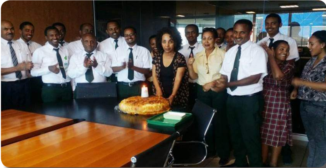
ADD Sales Office

Celebration of 70 years Anniversary at some of our Offices