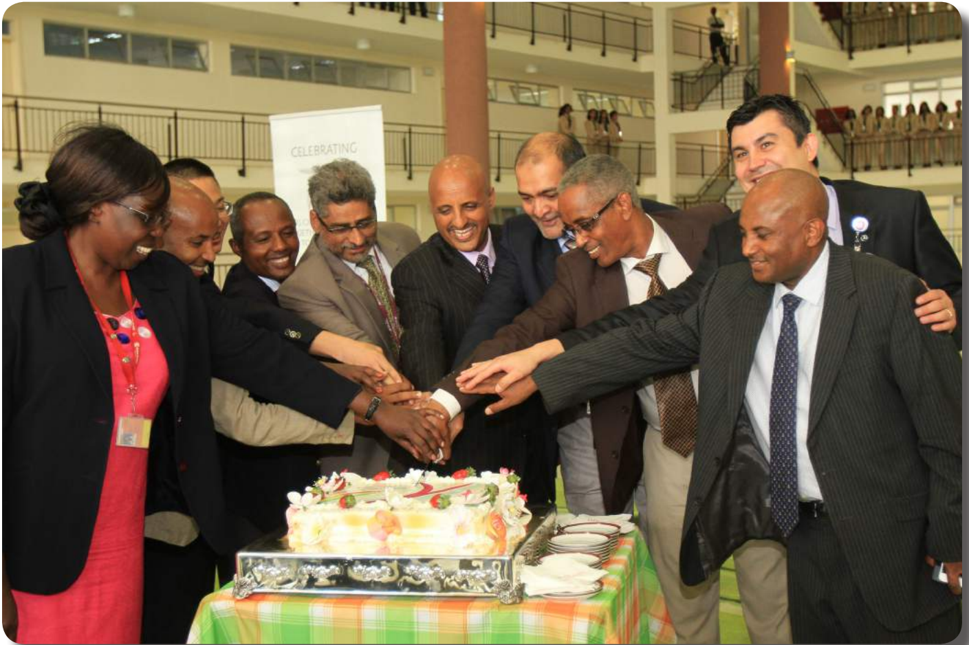
Official celebration of Ethiopian 70th anniversary.

Young and Strong Ethiopian Airlines at 70!