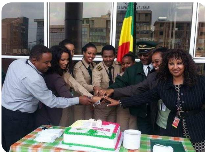
Ethiopian Aviation Acedemy