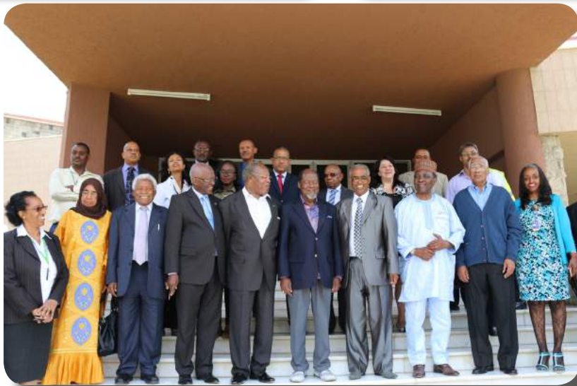
Journalists from Sudan