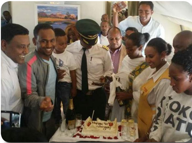
Onboard Dubai Flight

Celebration of 70 years Anniversary at some of our Offices