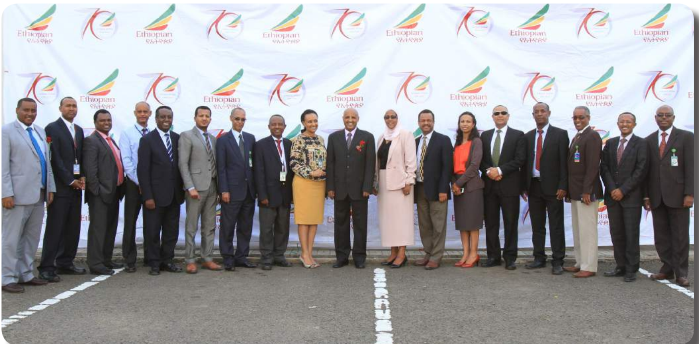
The Winning Soccer Team of Ethiopian Airlines