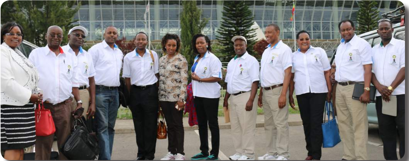
Sheba Miles Gold Members