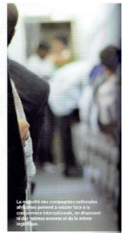
Le potentiel des compagnies africaines africaines peinent à exister face à la concurrence internationale, ne disposant ni des mêmes moyens ni de la même logistique.

est particulièrement actif en Afrique occidentale, où il compte faire d'Abidjan son hub régional, grâce notamment à Air Côte d'Ivoire dont il détient 20 % du capital. L'Afrique de l'Ouest représente en effet un marché potentiel de plus de 300 millions d'habitants. Grâce à son partenariat avec Kenya Airways, Air France-KLM compte également ouvrir un hub à Nairobi afin de capter les courants de trafic entre l'Asie et l'Europe. Cela lui permettra de faire face à la concurrence d'Ethiopian Airlines, qui rayonne depuis Addis-Abeba. Dans son plan pour l'été 2016, le groupe franco-néerlandais a annoncé l'augmentation des fréquences de ses vols vers certains pays d'Afrique : six vols hebdomadaires vers Luanda, un cinquième vol direct à destination de Kinshasa, un deuxième vol vers Bangui, en continuation de Yaoundé, ainsi que sept vols par semaine cet été vers Le Cap. En Afrique de l'Ouest, le groupe, qui propose déjà des vols supplémentaires vers Abidjan en continuation de Bamako ou de Ouagadougou, va déployer des appareils de plus grande capacité vers Dakar, Lagos et Cotonou. L'entreprise optimise également son réseau en Afrique de l'Est en augmentant le nombre de vols circulaires pour conserver une offre dans la région. Pour sa part, l'entreprise Turkish Airlines dessert 47 destinations vers l'Afrique. La meilleure compagnie aérienne européenne de ces cinq dernières années envisage l'ouverture